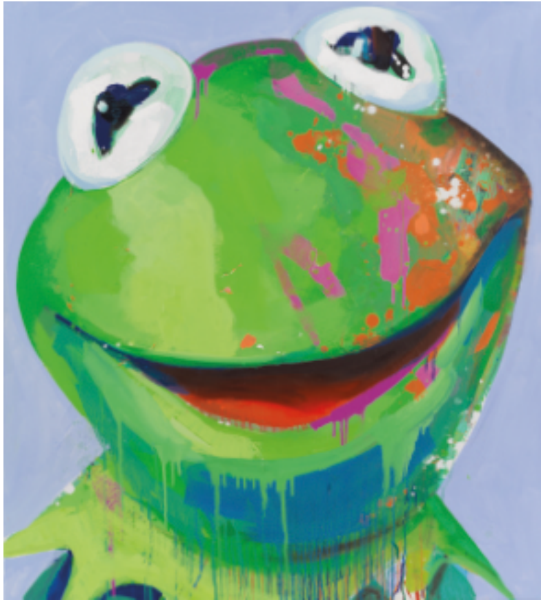
Kermit • 2022 • Ölfarbe auf Leinwand • 100 x 90 cm