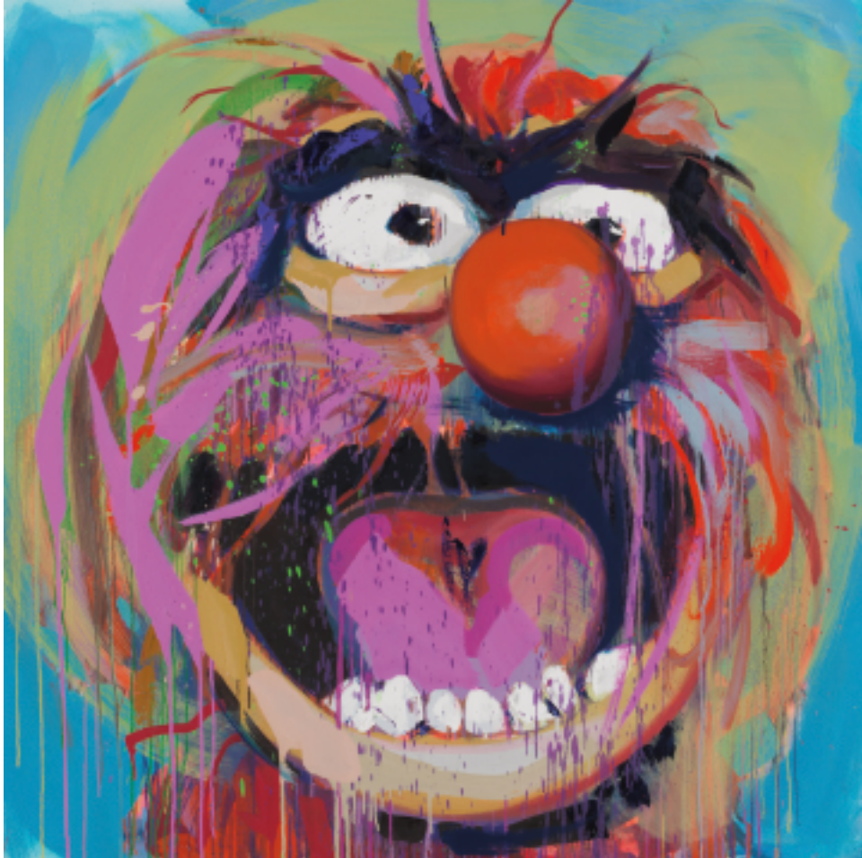
Das Tier • 2022 • Ölfarbe auf Leinwand • 115 x 115 cm