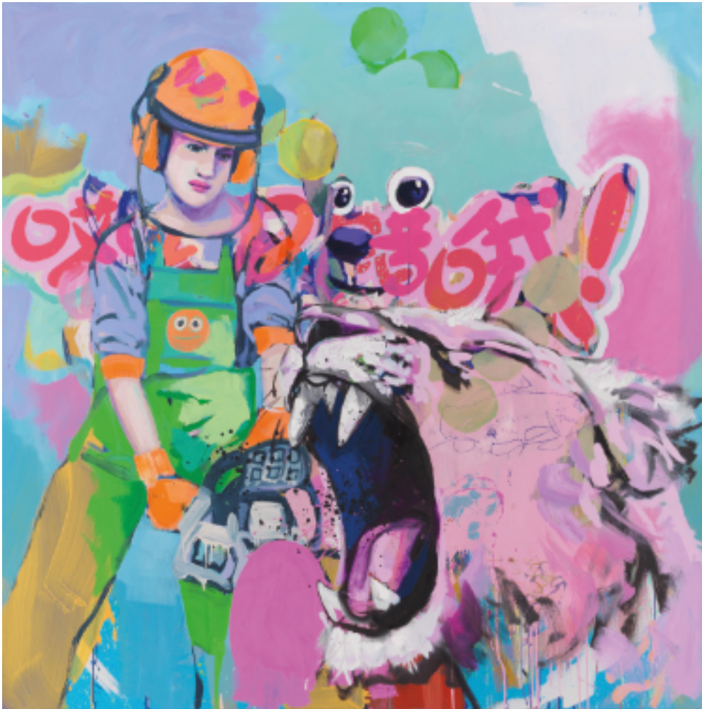
Cahos • 2021 • Ölfarbe auf Leinwand • 130 x 130 cm